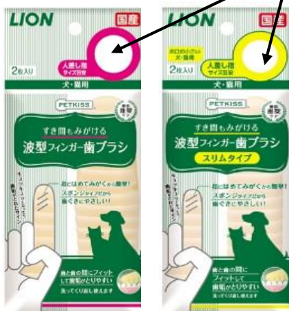
「指サイズチェック穴」