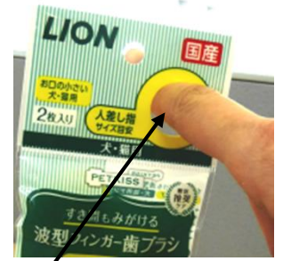
「指サイズチェック穴」